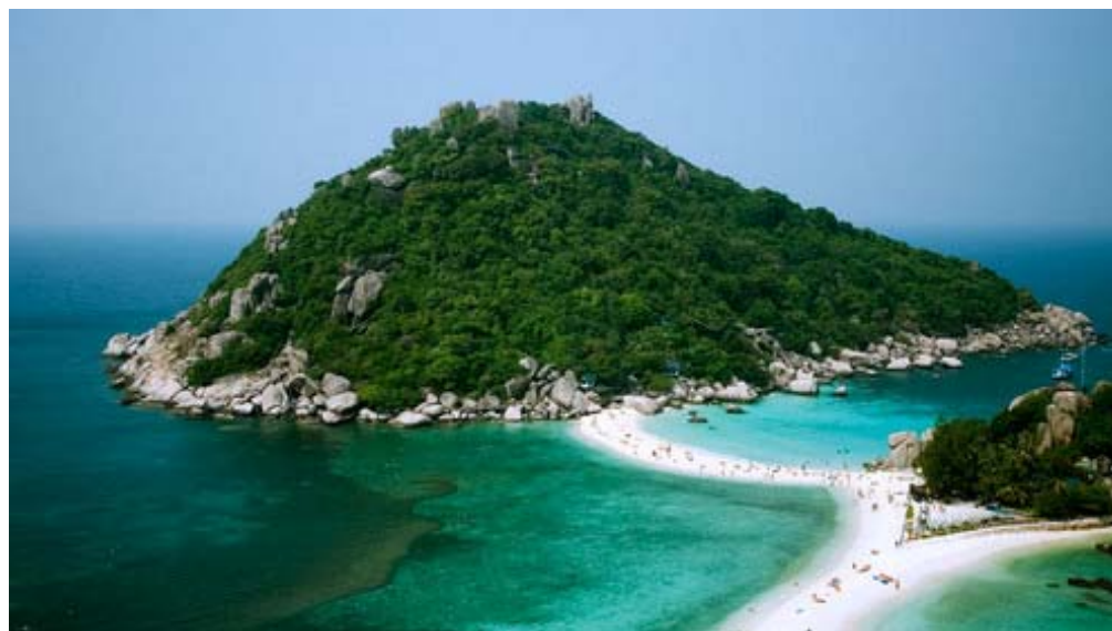
пляж Най Харн