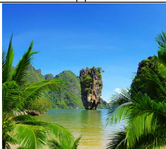
остров Джеймса Бонда